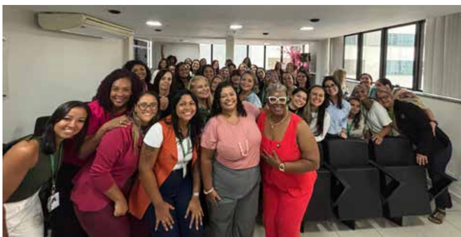
Na cooperativa elas correspondem a 67% do corpo funcional

A programação teve início nos dias 9 e 10 de março, com momentos de cuidado e integração. As colaboradoras puderam desfrutar de sessões de massagens relaxantes, além de um coffee break especial preparado para promover acolhimento e bem-estar. Um espaço instagramável também foi disponibilizado, incentivando a troca, o registro e o fortalecimento dos laços entre as equipes.