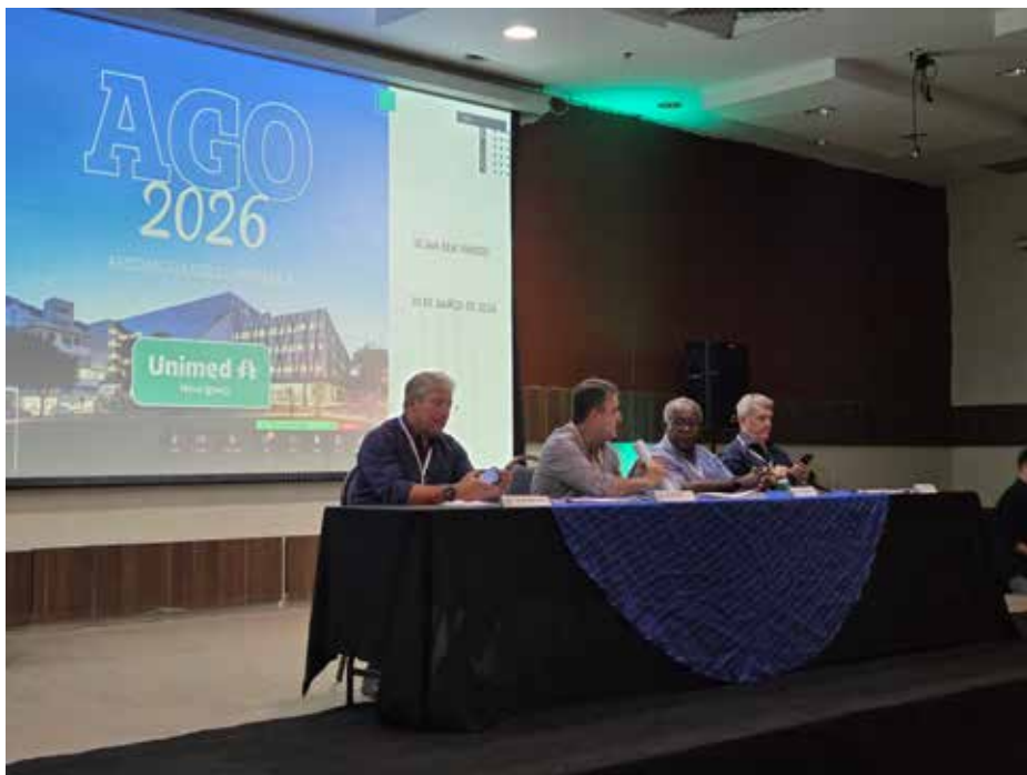
Diretoria executiva conduz assembleia com total transparência

Após o anúncio dos membros eleitos para o Conselho Fiscal, mandato 2025/2026, a diretoria executiva deu seguimento à apresentação dos resultados. Foram destacados a boa performance do trabalho de retenção e recuperação de clientes e a evolução dos recursos próprios. Outros pontos também foram apresentados: taxas de sinistralidade (contratos PJ, PF e Adesão), evolução da produção cooperada (local e intercâmbio), evolução da produção dos serviços e recursos próprios, evolução do capital social e patrimônio