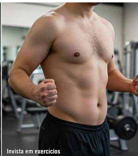
Invista em exercícios