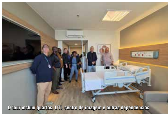
O tour incluiu quartos, UTI, centro de imagem e outras dependências