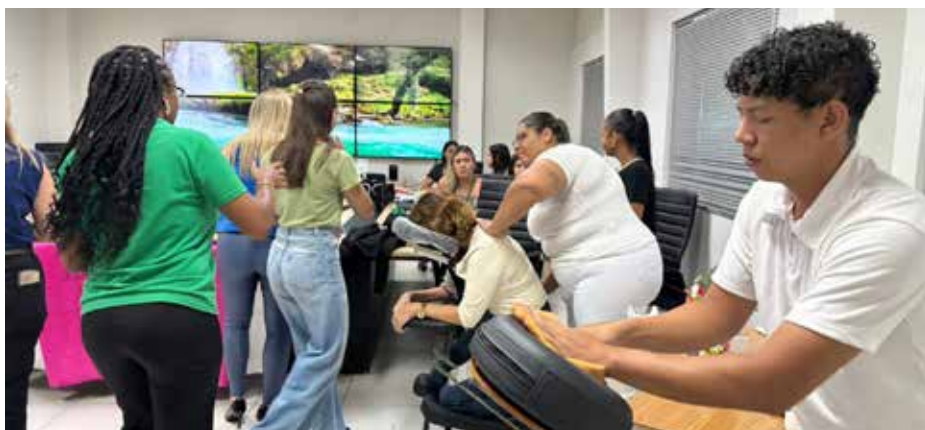
A programação contou com mimos e cuidados especiais para relaxar