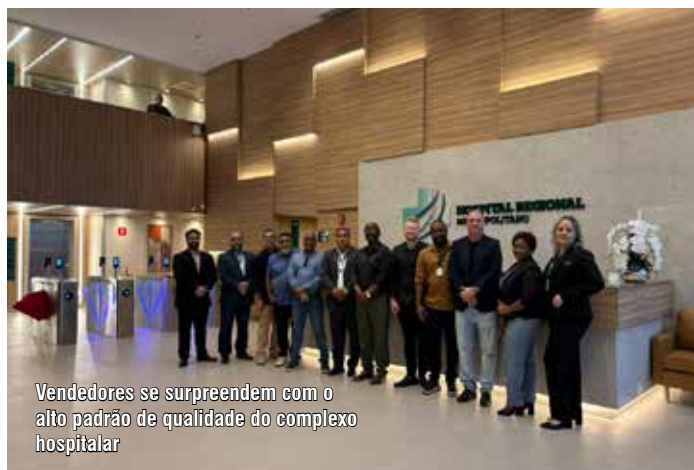
Vendedores se surpreendem com o alto padrão de qualidade do complexo hospitalar

As administradoras mantêm uma sólida parceria com a cooperativa fluminense, com forte atuação na comercialização de planos de saúde PME – segmento que possui grande relevância financeira e estratégica para a sustentabilidade da carteira de clientes e da operadora. A ação reforça o compromisso da diretoria executiva em investir em relacionamento, transparência e valorização de seus parceiros comerciais, fortalecendo ainda mais sua presença no mercado.