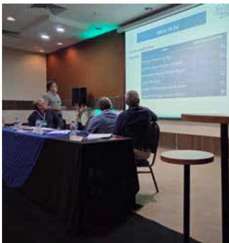
Presidente anuncia membros eleitos para o Conselho Fiscal mandato 2025-2026

dos cooperados, além do resultado operacional bruto e líquido.