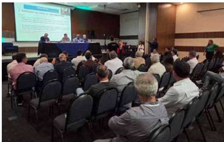
AGO destacou a primeira etapa de reestruturação financeira da operadora