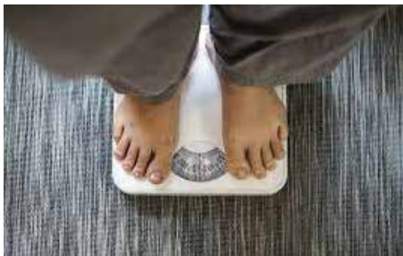
Emagreça de forma gradual